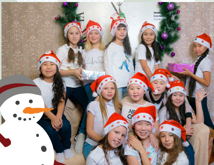
На фотографии девочки 4 а класса